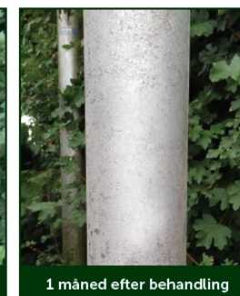
1 måned efter behandling