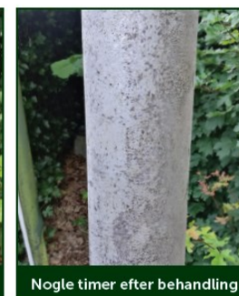
Nogle timer efter behandling